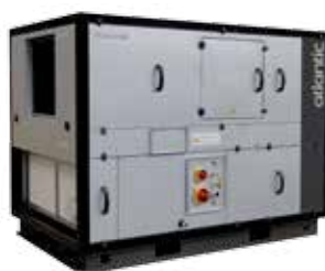
DUOTECH / ROTATECH Centrales double flux