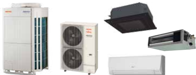
Gamme VRF Climatisation centralisée