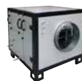
BTH Batterie thermodynamique