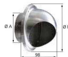
ME INOX 125 / 160

Manchon pour traversée de mur (réglable de 250 à 385 mm).