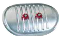
Trappe pour conduit circulaire