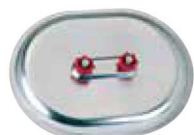
Trappe pour conduit rectangulaire